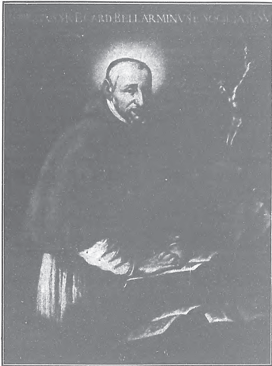
諾 彌 辣 伯 福 真