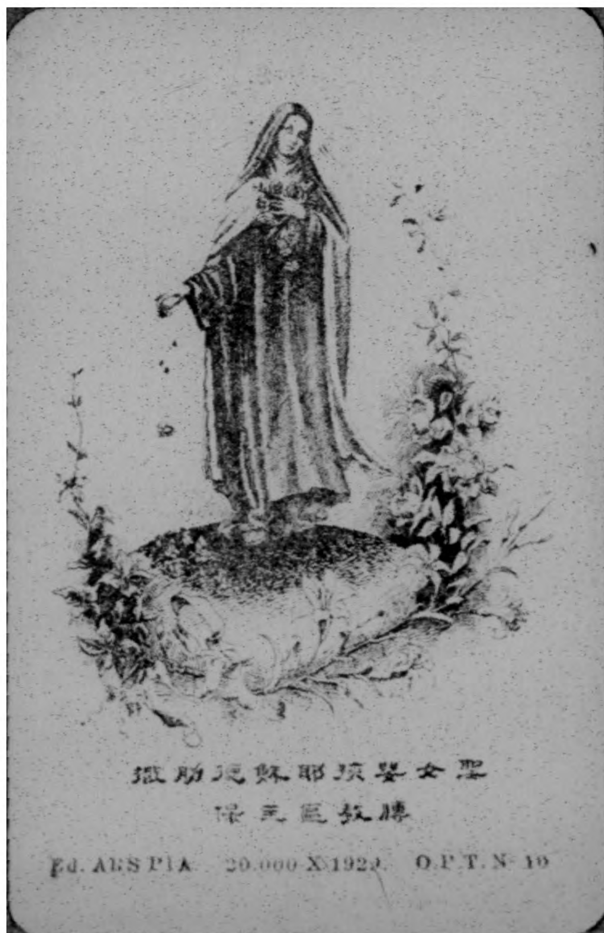
聖女嬰孩耶穌瑪利亞 保庇區教勝