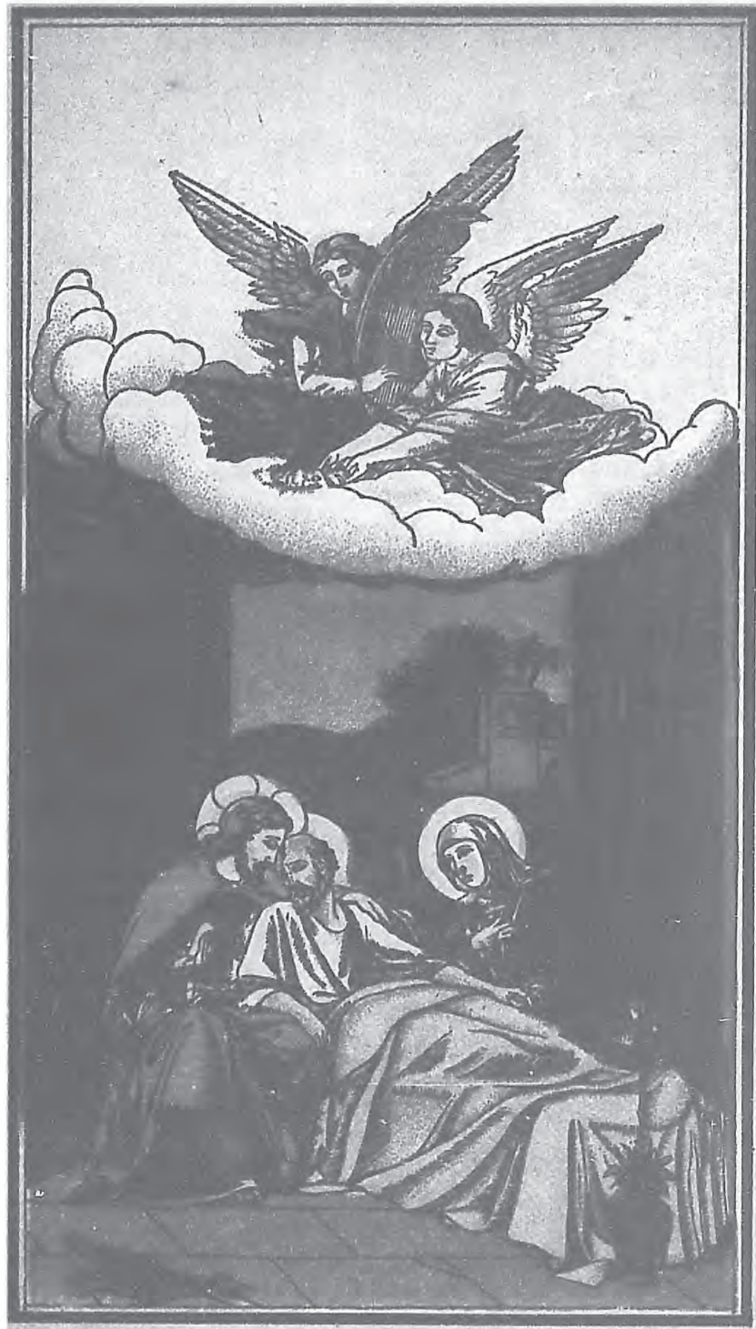
大 聖 若 瑟 善 終 主 保