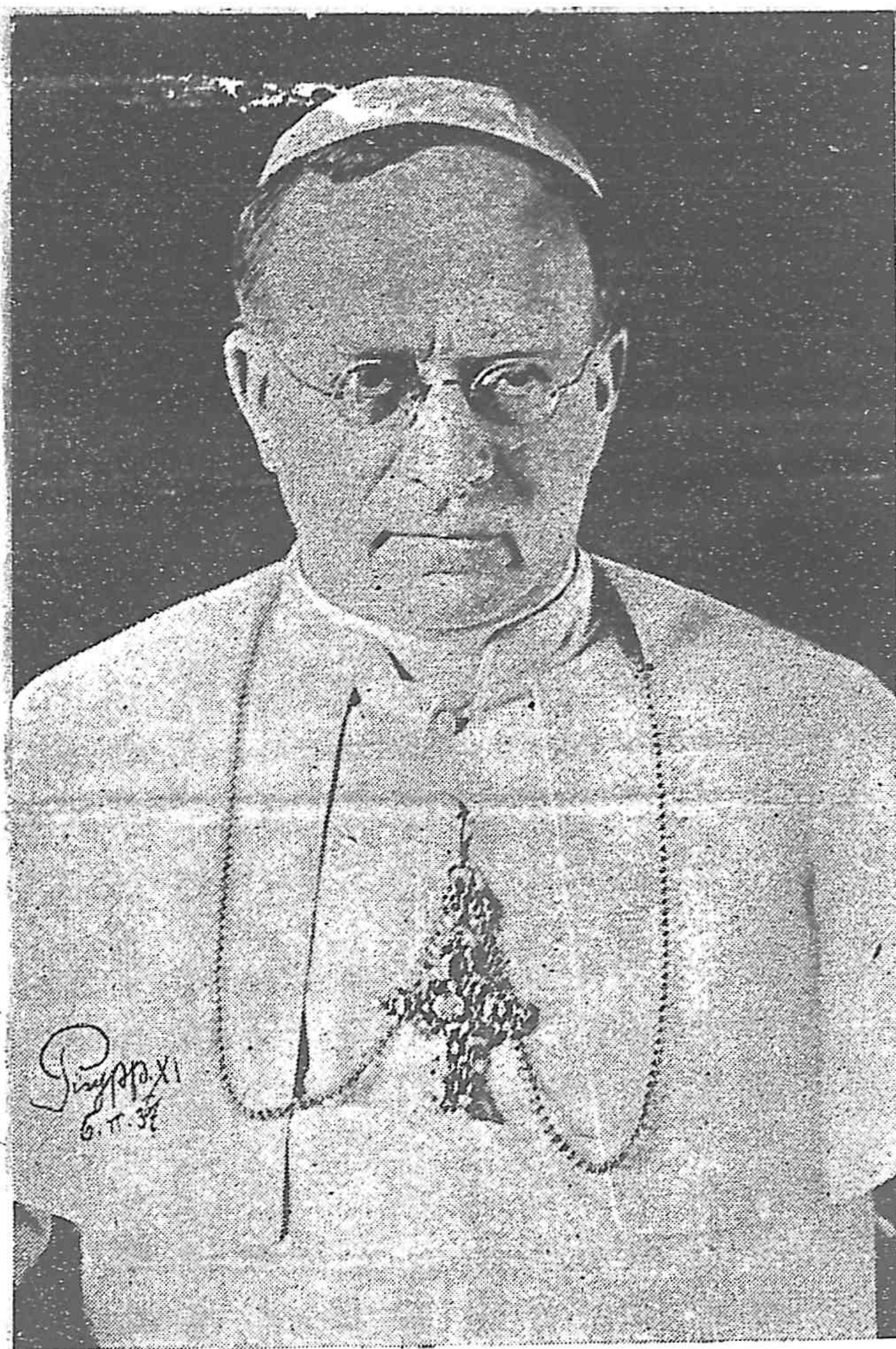
PIVS · XI · PONT · MAX

別人的靈魂，教友越恢復這熱心，天主的道理，即越廣揚，社會也越快改良，因為除了天主道理之外，沒有別樣法子，可以改良社會的！