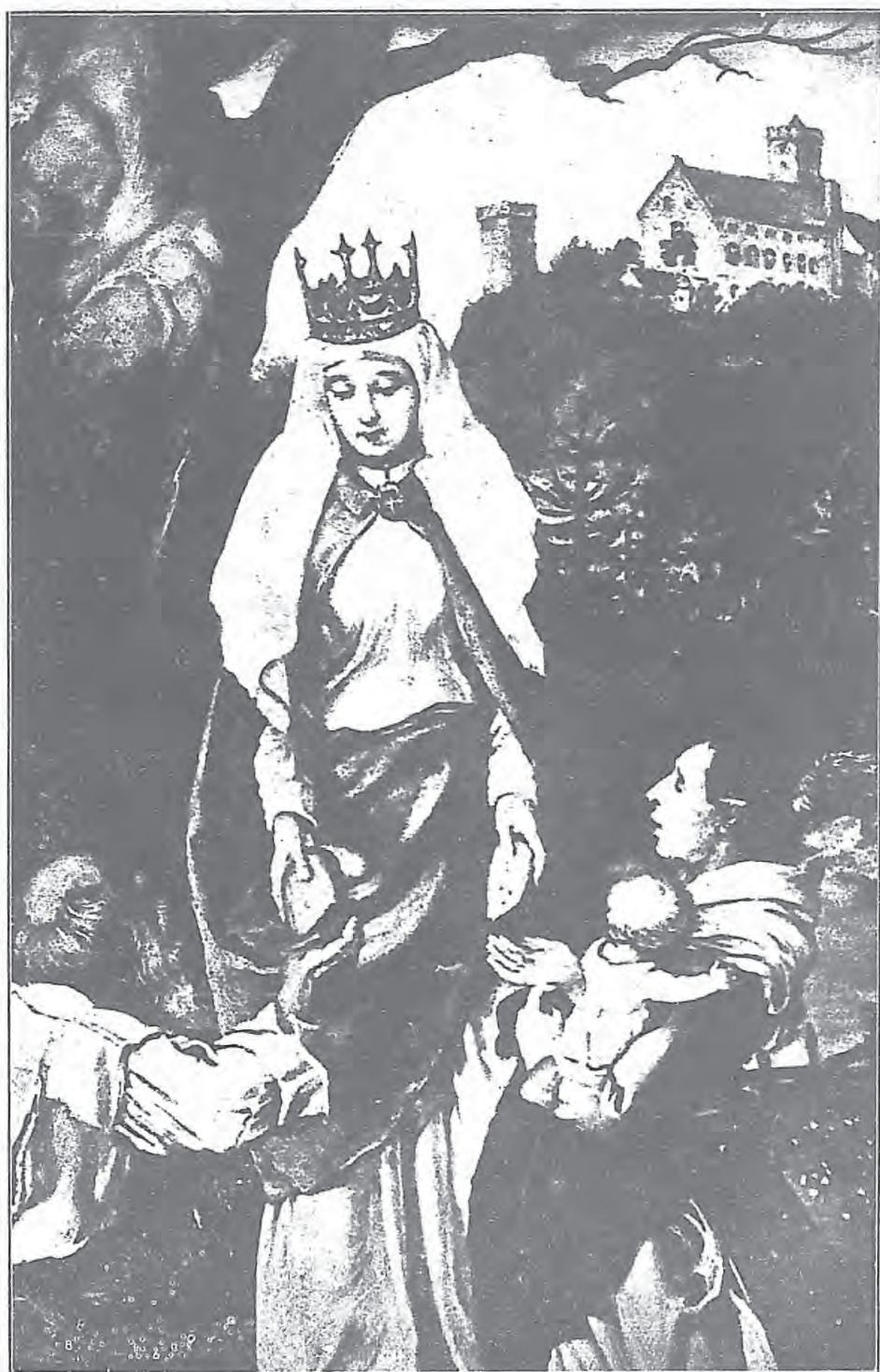
聖婦依撒伯爾在額依撒拿城救助窮病人