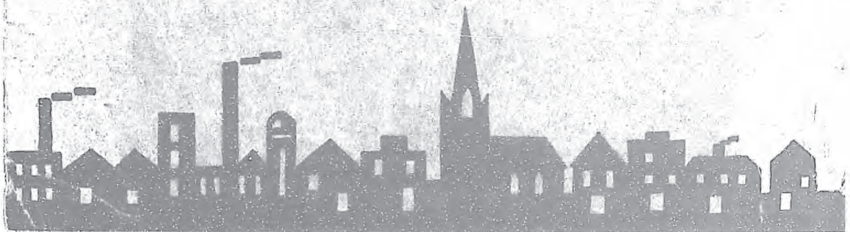
聖依撒伯爾屢次到裏來救助窮病的依斯拿城在瓦爾蒂宮