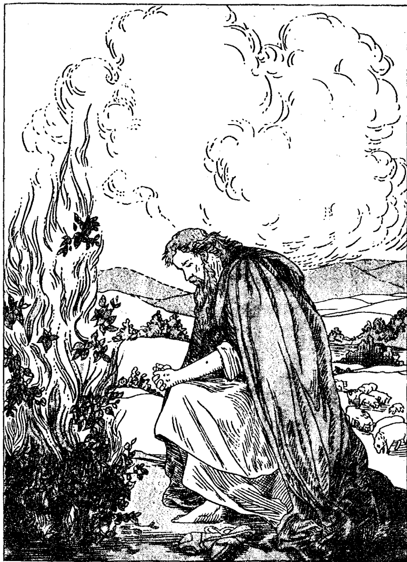
命 受 瑟 梅