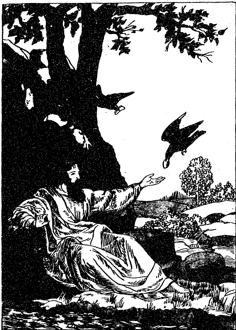
烏鴉給厄利亞先知送飯