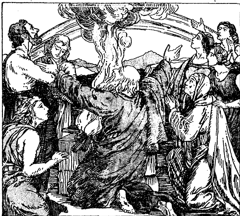
諾厄下船祭獻天主

這次鴿子沒再回來；於是諾厄將門開開一看，地已經都乾了。天主向他說：『率領一切生物下船到陸地上去吧！』他們重回到陸地上之後，諾厄就用石頭築了一個祭台，祭獻天主表示謝意。天主悅納他的祭獻，並且降福於諾厄和他的子孫們，命他們增加繁殖，佈滿大地，並應許以後不再以洪水淹滅世人，就在天上現出一道彩虹作為憑據。