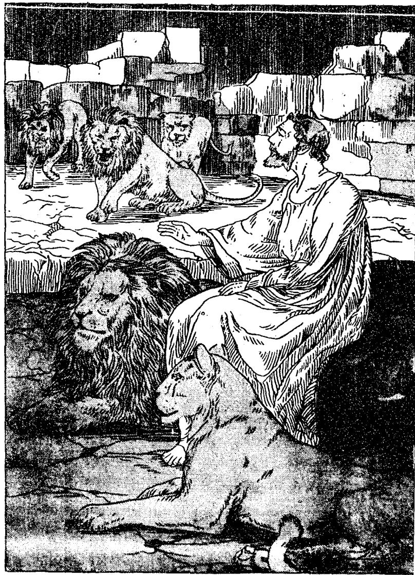
大尼厄爾被囚於獅圈裏