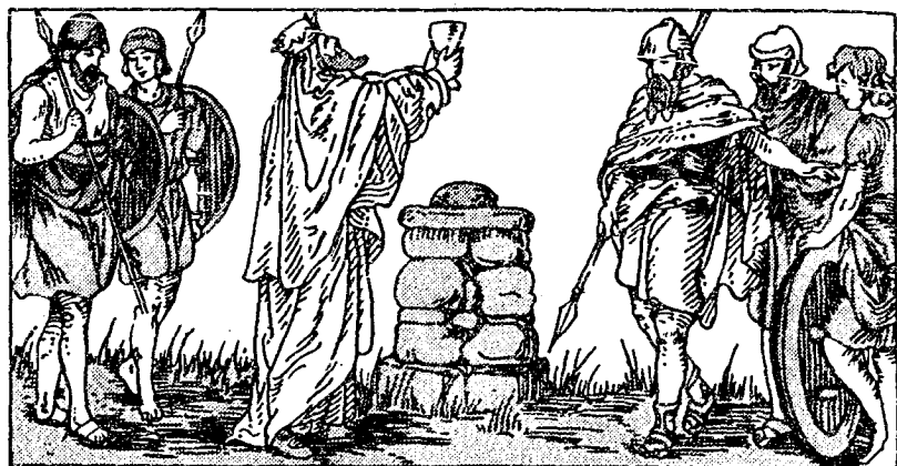
主 祭 德 塞 爾 基 墨

城。他們攻破了城，擄掠了人民和財物，連洛得自己和他的妻子及所有的一切都被擄去了。亞巴郎聽見這個信息，即刻帶了三百十八名家丁去追趕敵人，在當夜趕上了，打敗了敵兵，救了洛得和其他被擄的人們，奪回一切被奪去的東西。