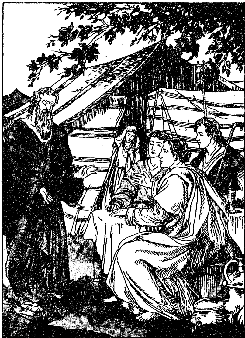
亞巴郎款待三客人