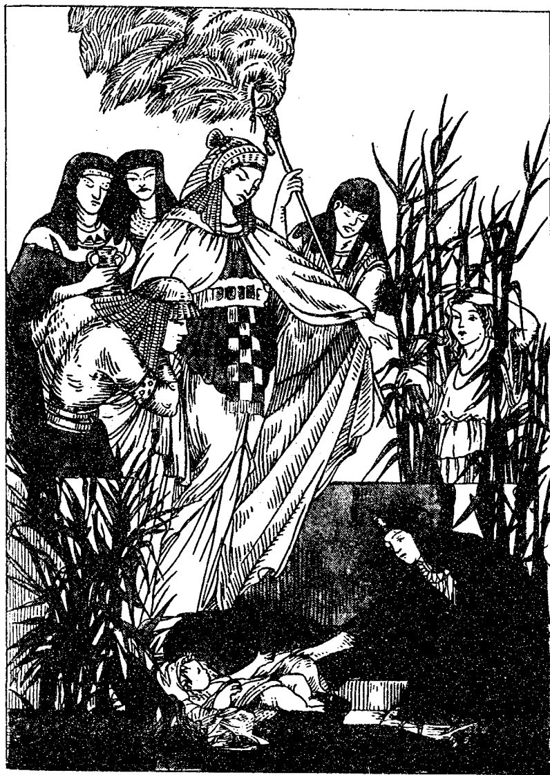
梅 瑟 得 救