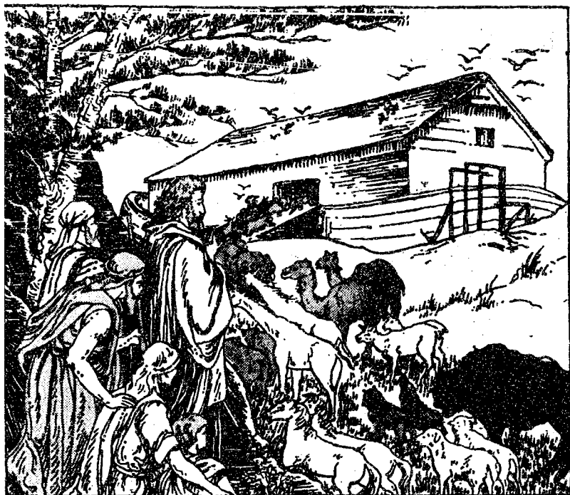
諾 厄 上 船

漸漸不敬奉天主，因為隨着加音的後代學壞了。不久，世界因此變成一個充滿罪惡的地方，人民也都忘記了天主。在諾厄的故事中，你可以得知天主如何處罰世間一切作惡的人，這些人都不敬愛事奉天主。