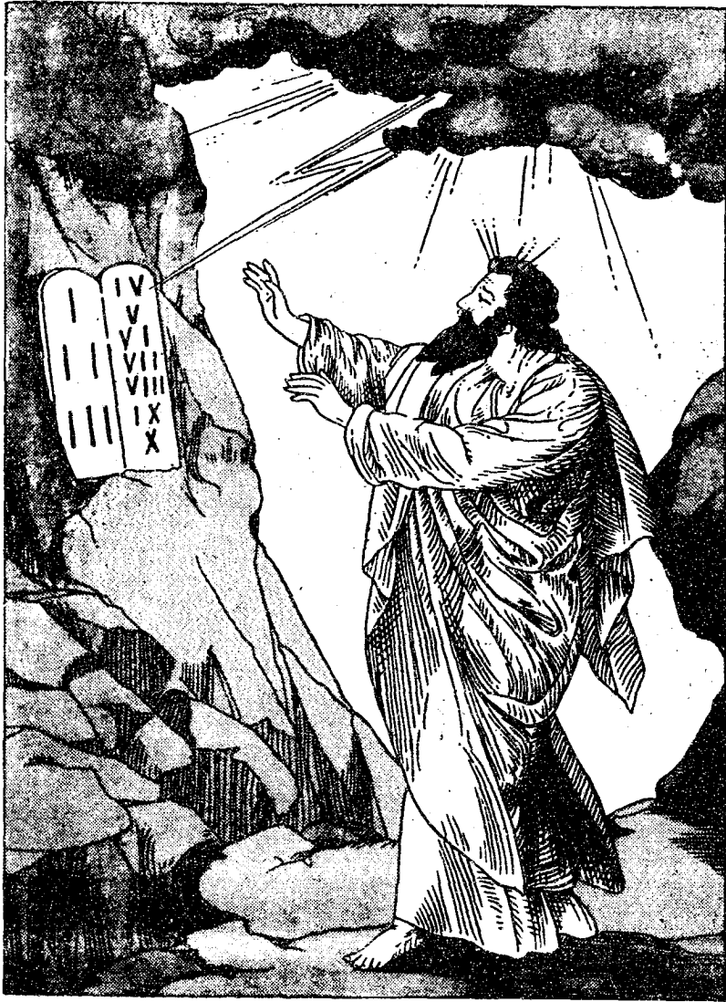
誠 十 佈 頒