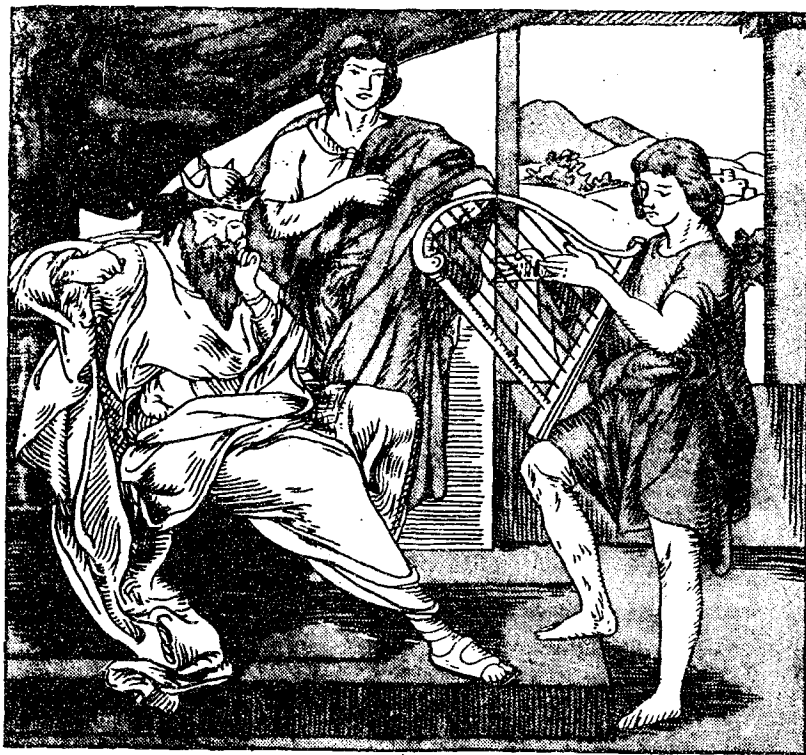
達味操琴娛撒烏耳