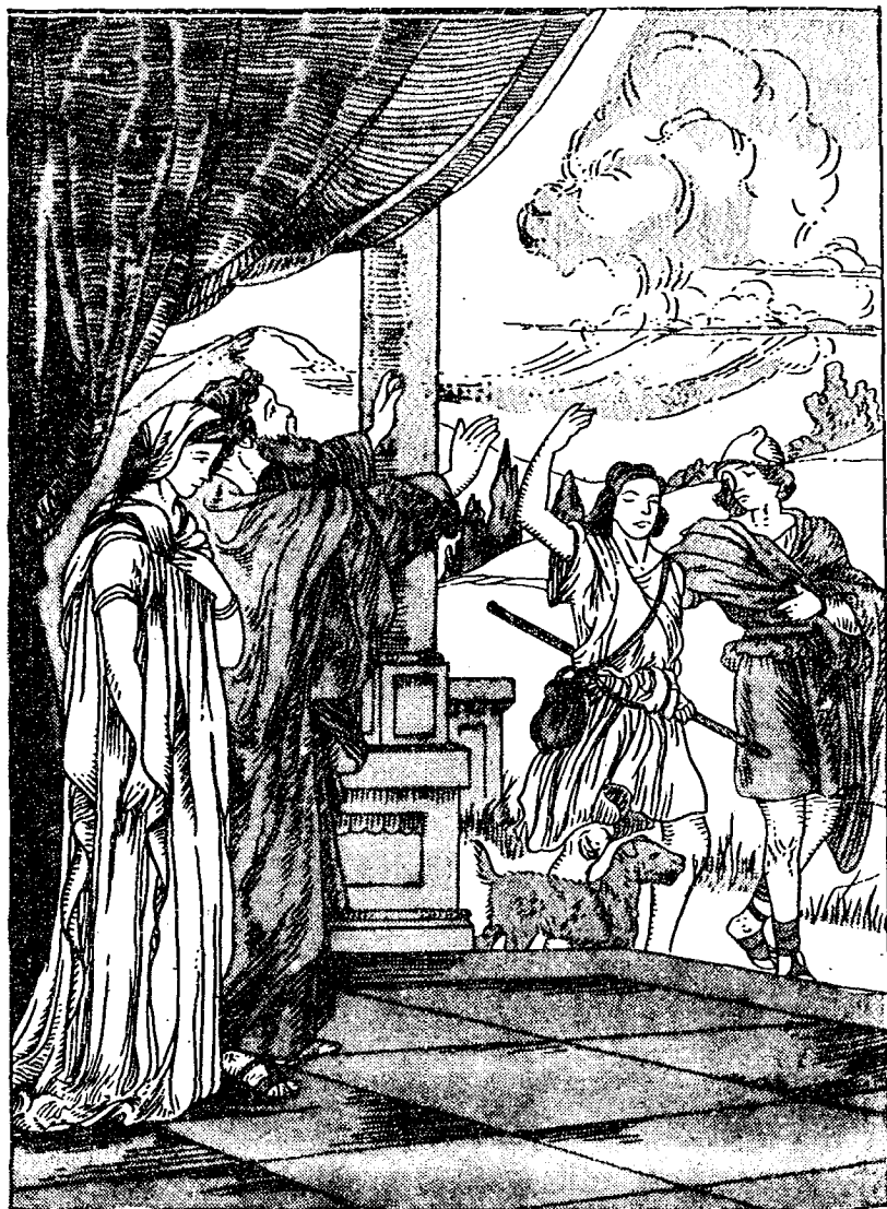
途入亞俾多少伴神天